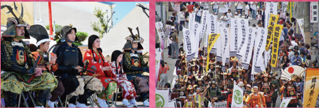
過去の一豊まつりパレード主役の皆さま

時間/10:00〜 ※雨天の場合、パレード等は中止となります。 コース/外割田交差点→木曾川町銀座商店街→黒田小学校