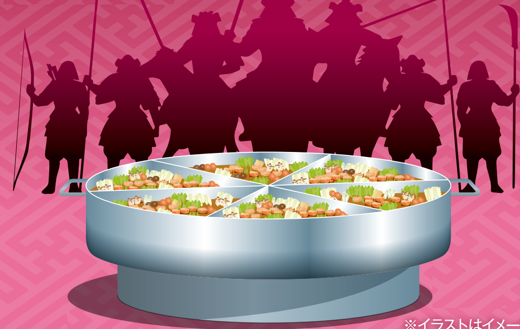
※イラストはイメージです。